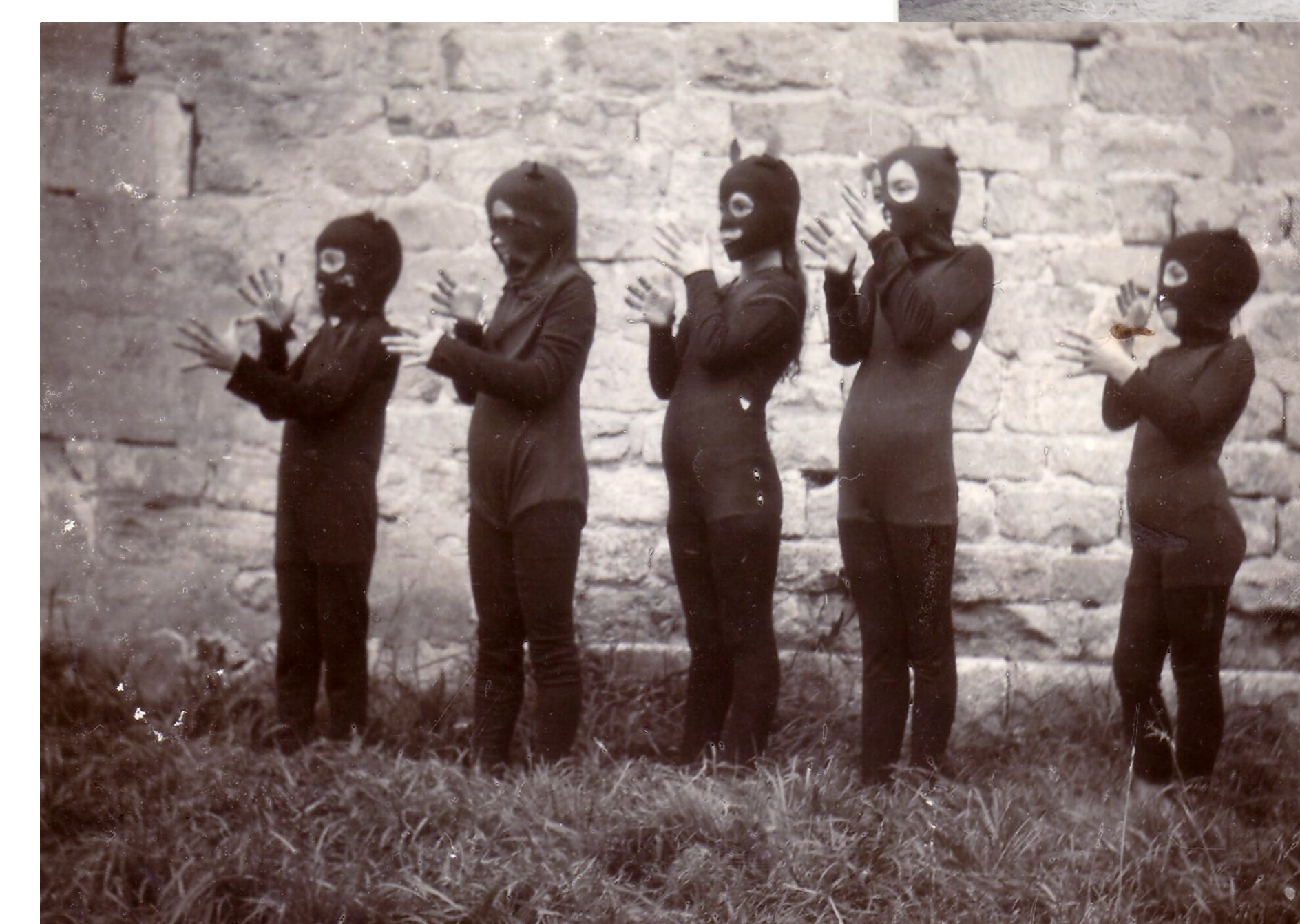
1956 Les 3 cheveux d'or du diable