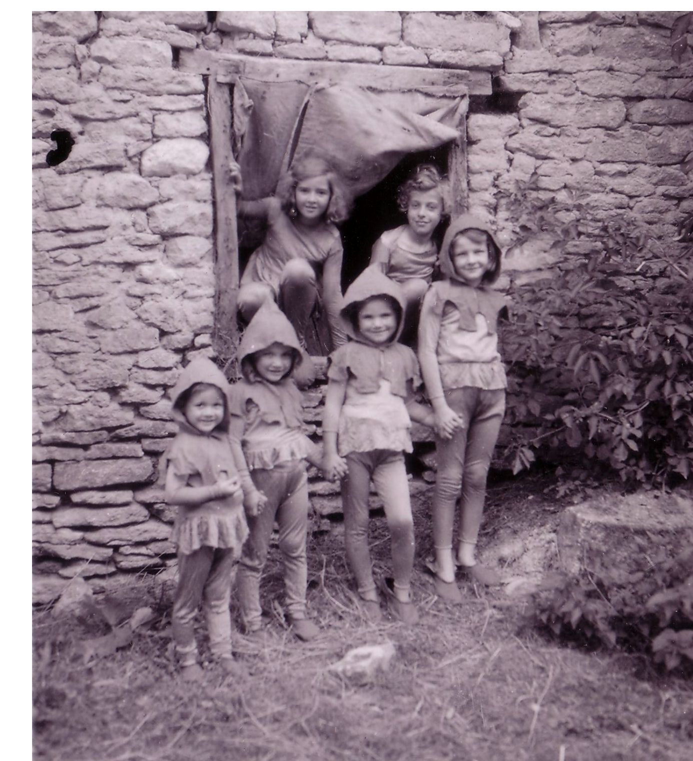
1943 : timide reprise du Théâtre