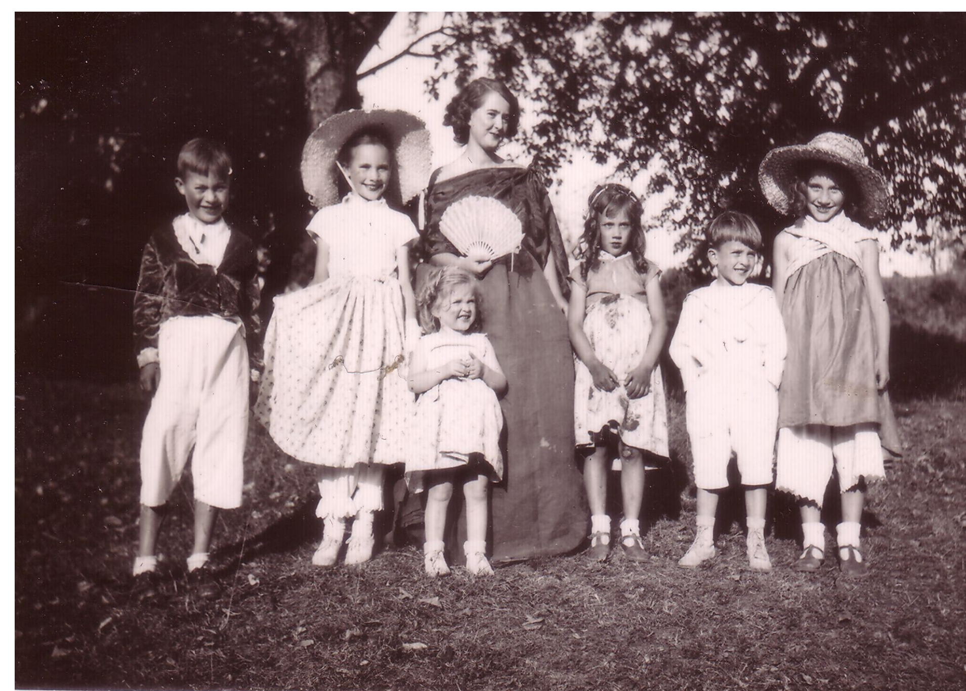
1947 : « Les petites filles modèles »

Après la Libération, certains anciens acteurs sont devenus des adultes avec un métier et la charge d'une famille. L'heure n'est pas à jouer la comédie, mais plutôt à retrouver une vie normale et à reconstruire les habitations et les hommes qui ont bien souffert.