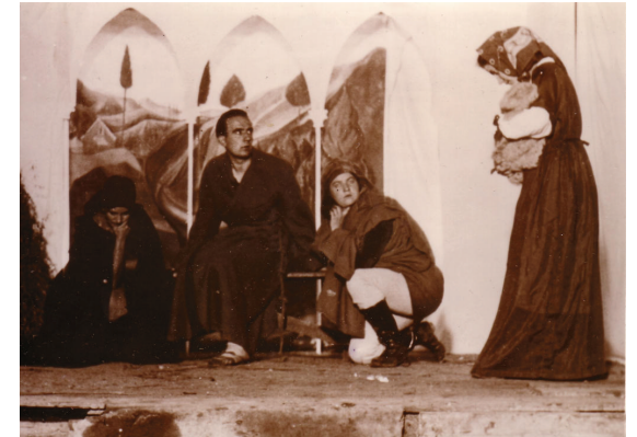
1932 : « L'annonce faite à Marie »