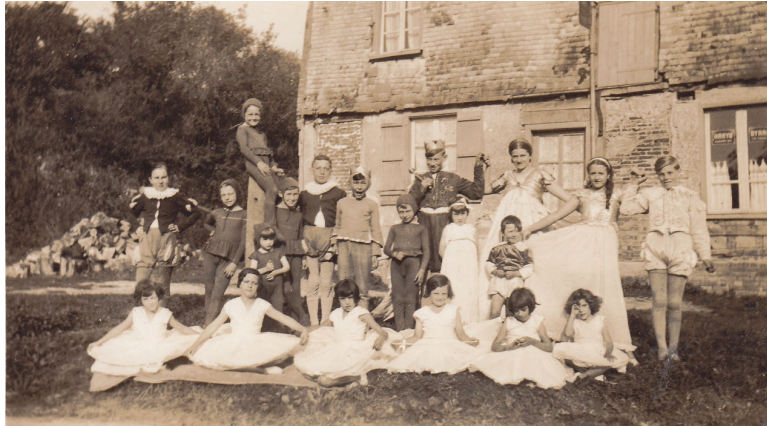
1934 : « La hutte dans le bois enchanté »

Comme il y a 25 garçons pour une seule fille, la distribution se révèle compliquée : sept garçons jouent les petites ogresses. Dans les années 30, il n'y a pas de photocopieuse, chacun écrivait donc, sous la dictée, le texte de la pièce pour apprendre son rôle.